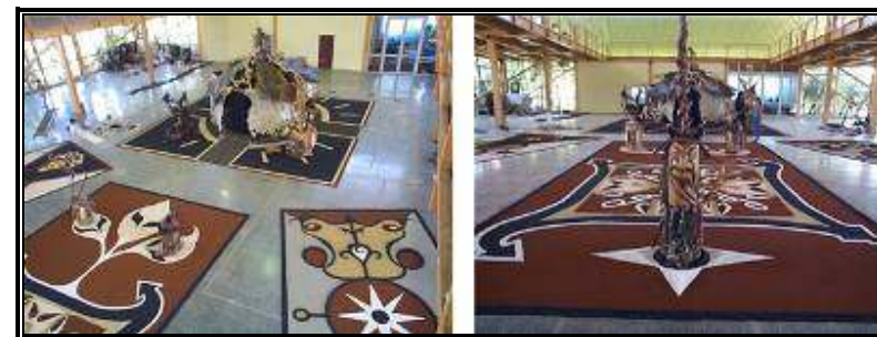
ExpoPerformance Año 2004

Consideramos las expo-performance como el resultado de nuestros saberes heredados, reinterpretados por el Taller Experimental Ennegro, y que son en esencia el arrancar un trozo de comunidad haitiana en su vivir cotidiano, y aun más profundo; un pedazo de la Sierra, darle color, un tratamiento de belleza y mostrarlo a la sociedad como un grito, que solo busca, integrarnos.