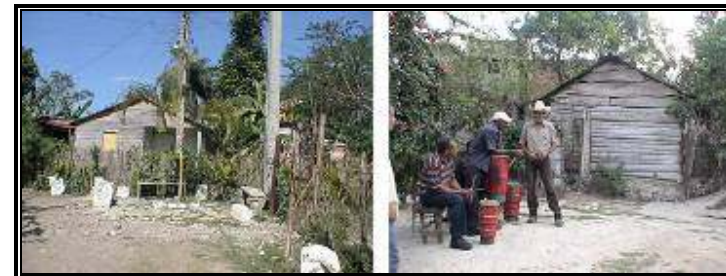
Áreas urbanas en que se localizará señalética, mobiliario urbano y elementos de iluminación.

En el conocimiento del rol que tiene la señalética, como elementos que brindan información y al mismo tiempo comunican, conscientes del valor de utilizar las mismas herramientas de la cultura globalizada y globalizante, y considerando la necesidad de dar una lectura comunicacional unitaria a este tipo de información con la que ocupamos una gran parte del territorio, tanto en el área urbana y rural, como en las vías de llegada y accesos, sumado a ello, la importancia del diseño del entorno, en el equipamiento, diseño vegetal e iluminación, tanto para Vevé de Afá, Sitios Memoria, servicios socioculturales en área urbana, y sus conectores integrados: planificados como conectores identitarios, proponemos: