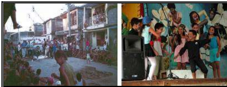
Rabo de Nube