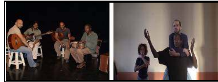
Expresión contemporánea de nuestras tradiciones : música y teatro

Estas acciones, tienen a su vez, su propio corolario anual, un festival que los participantes a las actividades construyen, con el apoyo de la AHS.