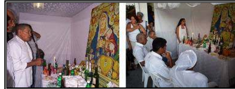
Ceremoni Table Blanche

Es una ceremonia que es parte del complejo ceremonial que cada Hougán debe realizar cada dos años en la comunidad donde vive.