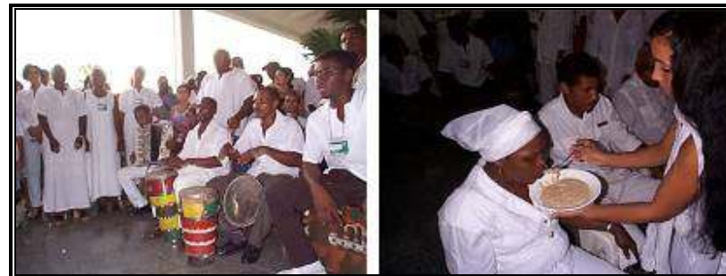
Expoformance: Música y gastronomía ritual

festivo incluido en el Programa de Revitalización de Fiestas Populares