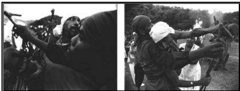
Festividad en Barrancas

comunidad o poblado, como lugares de salida, que luego se concentrarán en Vevé de Afá en su expresión final.