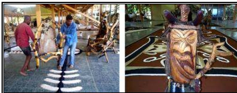
ExpoPerformance en Expo Cuba 2004

todo el país, y varias internacionales que apoyan nuestra filosofía y metodología.