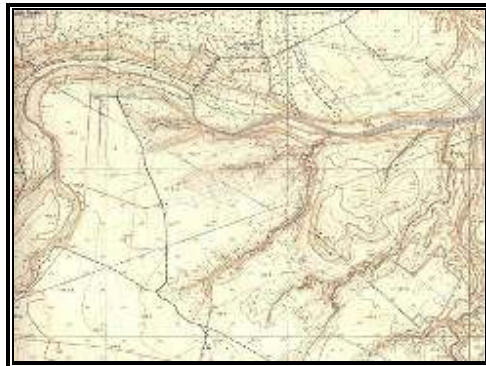
Levantamiento planimétrico del terreno