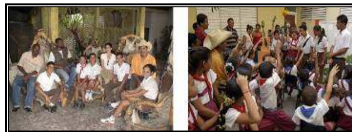
Integrantes del grupo GITMA y del Taller Experimental ENNEGRO.

Ambos proyectos son complementarios, de todas las acciones educativas y extensionistas que se reforzarán cuando Vevé de Afá esté concluido, y funcionando su Aula Ecológica.