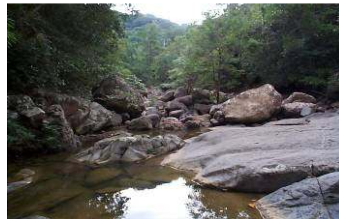
Ambiente natural, localización del Pegòn (Hounfò) del Hougàn Tato Milanès